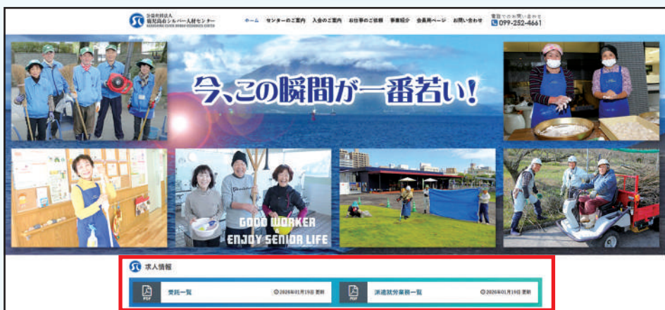
鹿児島市シルバー人材センターのホームページ