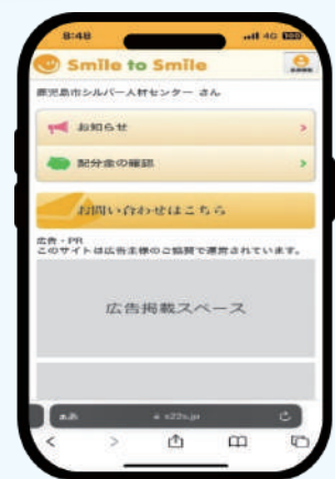
Smile to Smile

ご自身のパソコン、スマートフォンから就業情報の確認ができます。(月曜日更新) 興味のあるお仕事があれば、お気軽にセンターへご連絡ください (^_^)