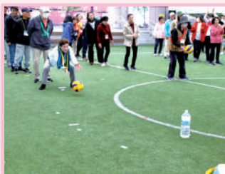
ピンを倒せるかな?