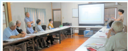
吉田支部での様子