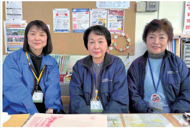
ジョブコーディネーター (センター本部 1階)