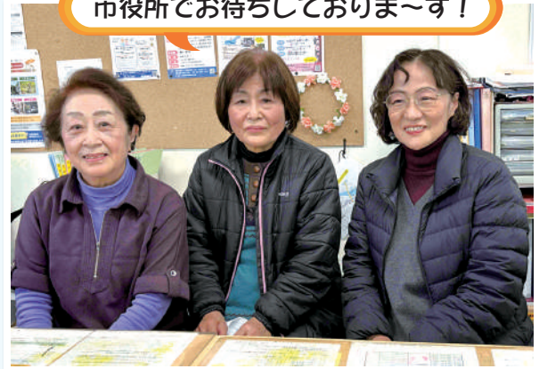
高齢者就業コーディネーター (市役所 東別館 1階)

お仕事の紹介やご相談、近況確認のためにお電話を差し上げています。 主に携帯電話から連絡しますので、下の番号登録をお願いいたします。