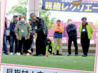
目指せ!ホールインワン