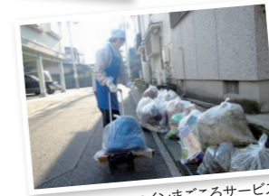
ワンコインまごころサービス(ゴミ出し)の様子

有料老人ホームの仕事 新しい経験、仲間ができて楽しい。働くようになって元気になったと言われる。