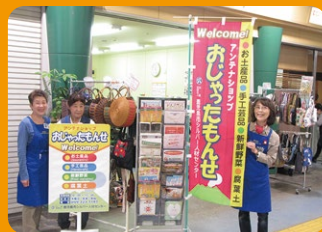
ショップ:おじいちゃんもははちゃんも