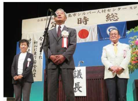
川原新互助会会長 あいさつ