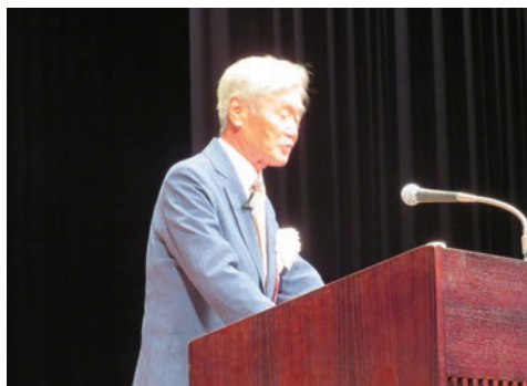
中川互助会会長あいさつ