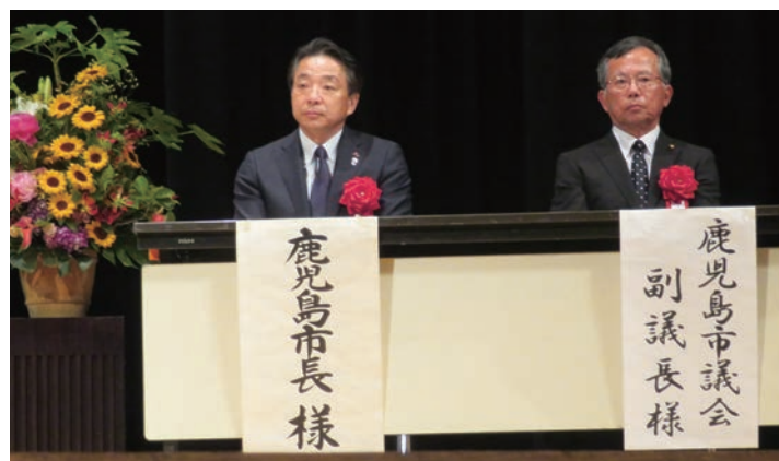
来賓をお迎えして