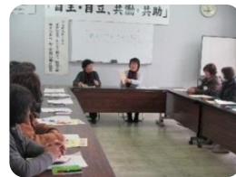
☆生活支援の研修中

1月15日(金)、生活支援を希望する新人会員へ向けて研修会が開かれました。講師会員よりマニュアルに沿って、就業にあたっての基礎を学習しました。