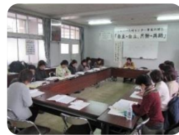
☆子育て支援の研修中