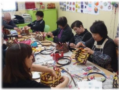
紙バンドで籠を作りました。