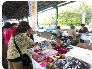
わくわく福祉交流フェア