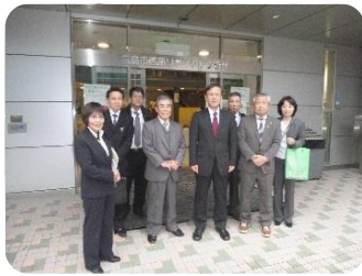
リサイクルプラザ視察