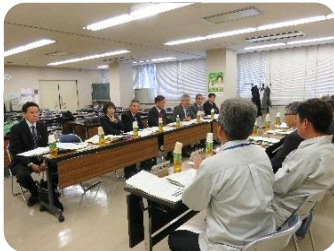
意見交換しました

11月25日(水)～26日(木)にかけて、役員6人、事務局職員2人の合計8人で広島市シルバー人材センターを訪問し、「会員の拡大・就業機会の拡大、安全就業の取り組み状況」等について、研修を行いました。併せて広島市SCの自転車リサイクル及びショップの就業現場を視察しました。研修中は活発な意見交換が交わされ、非常に充実した研修となりました。