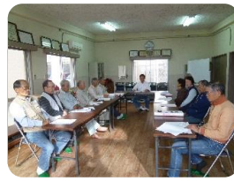
意見を交わした緑ヶ丘班の皆さん

11月は各地域で、班会やボランティア等が開催されました。緑ヶ丘班は、雨天のためボランティア活動は中止でしたが、班会が催され様々な質疑が交わされました。小野班は、小野公園駐車場付近で熊手等を使い、落ち葉の掃除を行いました。皆さんお疲れ様でした。