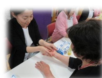
メナード フェイシャルサロン かごしま東