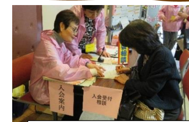
当日は、入会相談とお仕事相談も受けました