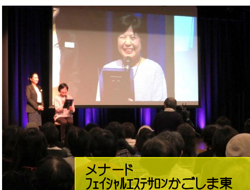
メナード フェイシャルサロンかごしま東