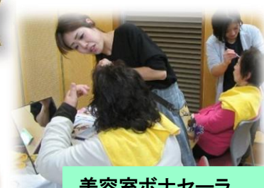
美容室ボナセーラ