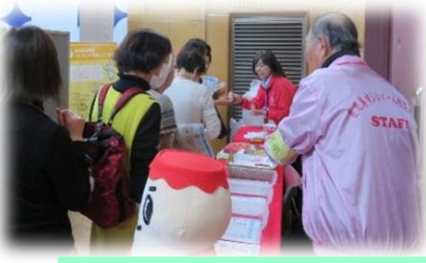
鹿児島ヤクルト販売(株)